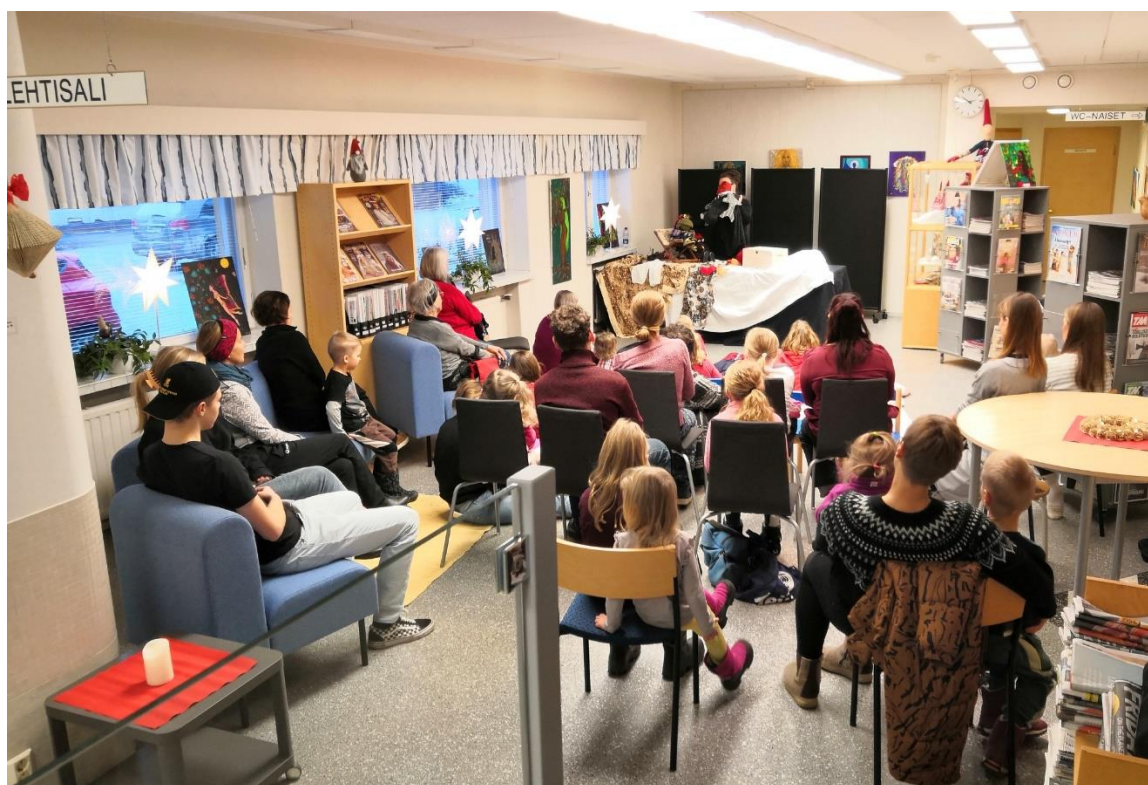
Sammakon joulunäytelmä kirjastossa

Tarkastuslautakunta tutustui koulukäyntien yhteydessä myös varhaiskasvatukseen ja kuuli päiväkodinjohtajaa.