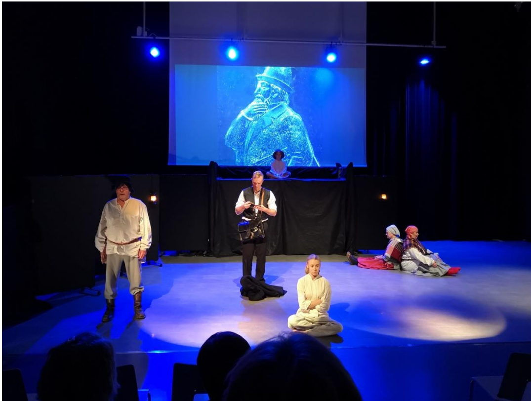
Daniel-juhlanäytelmä Savitaipaleen suurmiehestä D.E.D.Europaeuksesta