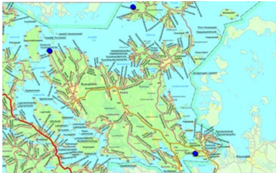
Muutoskohteiden seudulliset sijainnit

Yleiskaavan muutoskohteet sijaitsevat Savitaipaleen kunnassa Suur-Saimaan ranta-alueilla.