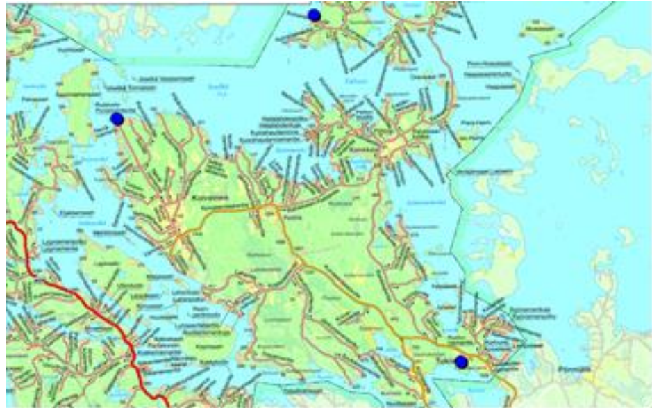
Muutoskohteiden seudulliset sijainnit

Yleiskaavan muutoskohteet sijaitsevat Savitaipaleen kunnassa Suur-Saimaan ranta-alueilla.