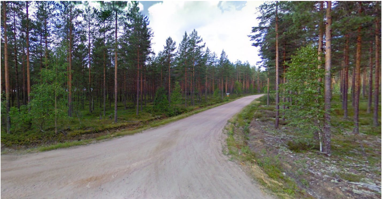
Kuva 2. Selkäkankaan alueen maastoa.

Kaavalla ratkaistaan yleispiirteisesti, mutta kattavasti Kirkonkylän eteläisten osien maankäyttö ja ohjataan tarvittaessa kunnan maanhankinnan tarpeita. Tavoitteena on turvata alueella sijaitsevien työpaikkatoimintojen tulevaisuus ja mahdollistaa niiden kehittämis- ja laajenemistarpeet. Alueelle on suunnitteilla myös teollisen luokan aurinkosähkön tuotantoalue.