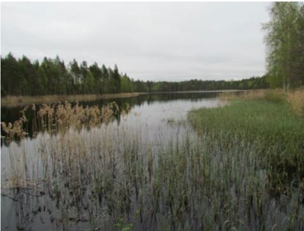
Kuva 3. Karkjärven rantaa

Kunnan taajamarakenne on levittäytynyt nauhamaisesti valtatie eteläpuolelle. Alueelle on sijoittunut sekä pientalovaltaista asumista että pienteollisuutta. Asemakaava eteläpuoliset osat ovat suurelta osin metsätalousvaltaista aluetta. Haja-asutusmaista vakituista asumista ja loma-asumista on hyvin vähän. Alueella on muutamia pienvesistöjä.