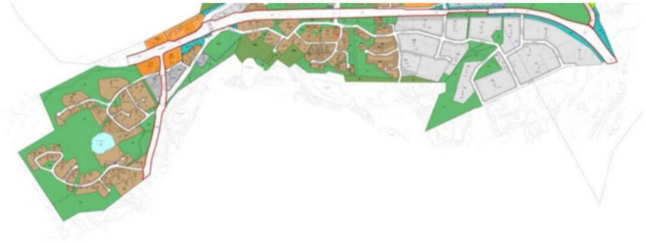
Kuva 6. Alueen ajantasa-asemakaavaa

Suunnittelualueella voimassa useita asemakaavoja. Näiden lisäksi suunnittelualueella on käynnissä muun muassa teollisuusalueen asemakaavamuutos