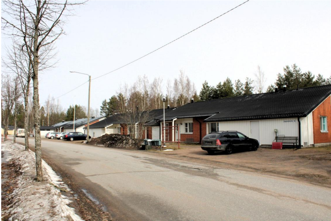
Kiinteistö Oy Savitaipaleen Vuokratalot, Supanahontie 1

Teknisen lautakunnan osalta toimintakate on toteutunut 47,4 %:sti. Toimintatuotot ovat ylittyneet 577 keur ja toimintakulut alittuneet 452 keur.